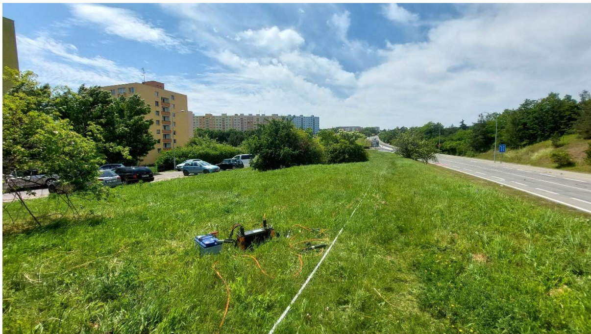
Obrázek 1: Měření ERT na profilu P5.