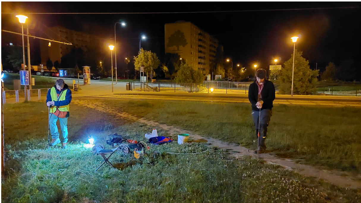
Obrázek 7: Měření VES na bodě BP2