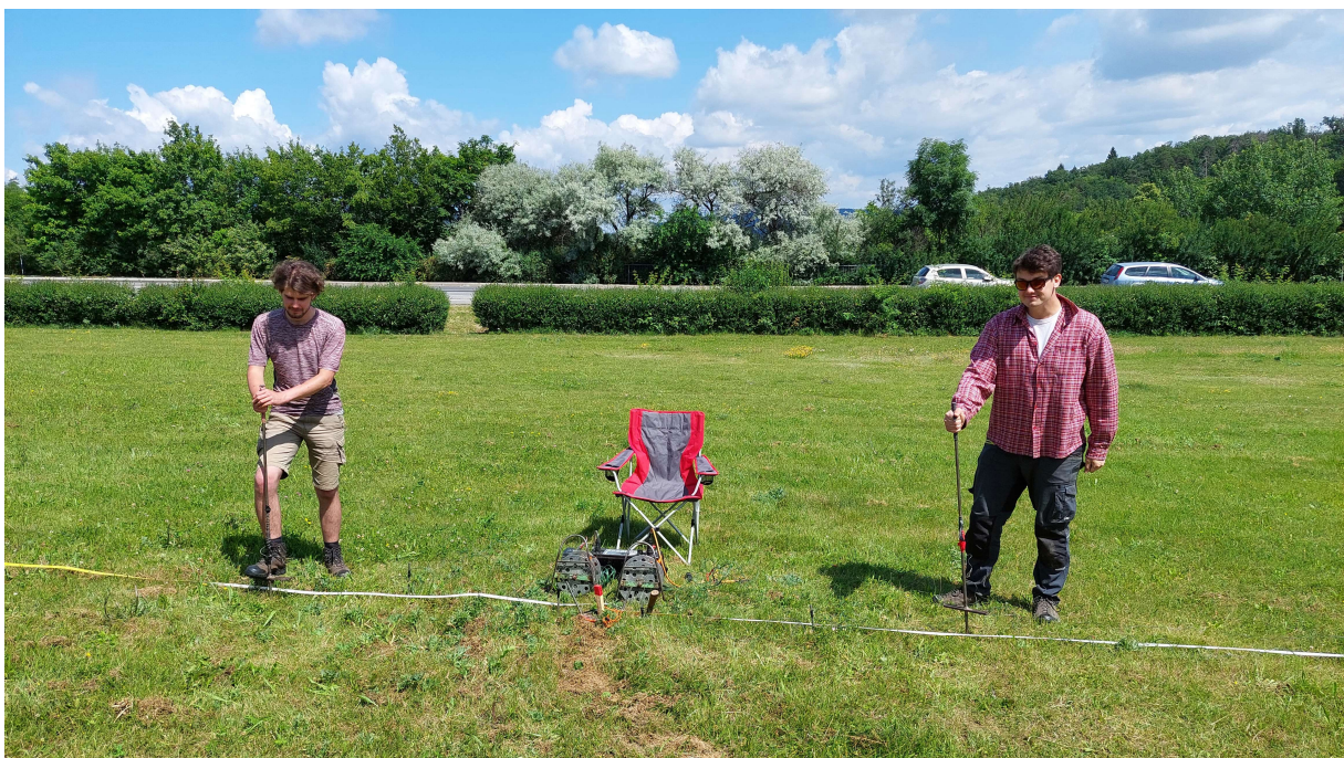
Obrázek 8: Měření VES na bodě BP5