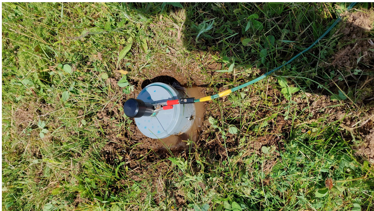
Obrázek 9: Měření korozivity na bodě BP5