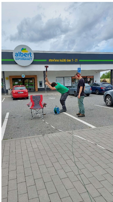
Obrázek 5: Měření MRS na profilu P-D