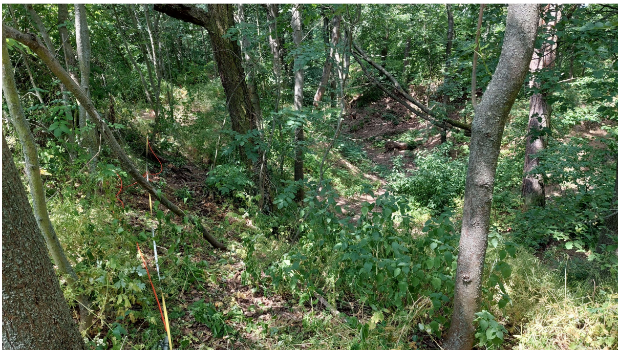
Obrázek 3: Měření ERT na profilu P2-4