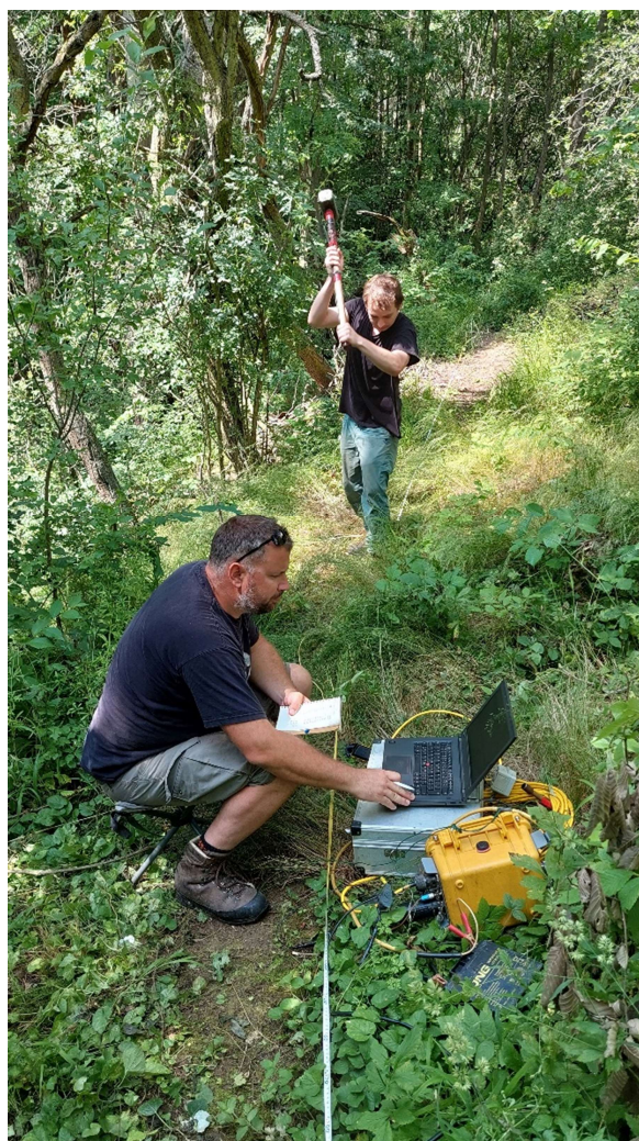
Obrázek 4: Měření MRS na profilu P1