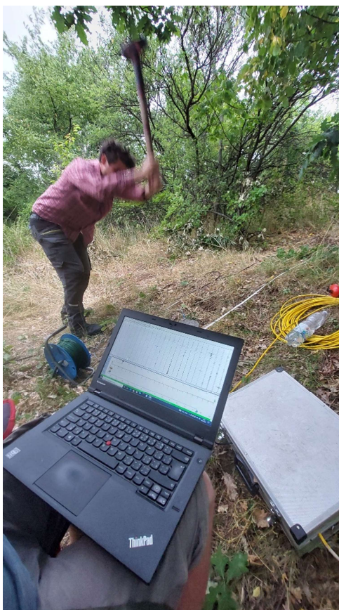
Obrázek 6: Měření MRS na profilu P2-4